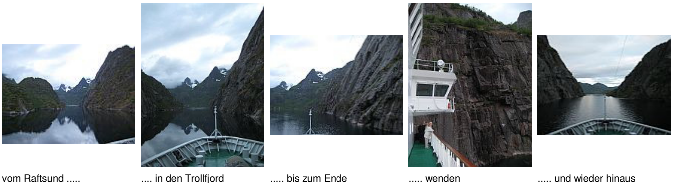
vom Raftsund ..... .... in den Trollfjord ..... bis zum Ende ..... wenden ..... und wieder hinaus

Der Fjord ist 2 km lang und an der Mündung auf der Westseite des Raftsund nur 100 m breit. Da der Fjord keinen "Ausgang" hat, muß der Kapitän das Schiff wenden.